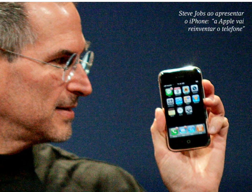
Steve Jobs ao apresentar o iPhone: “a Apple vai reinventar o telefone”

Graças as revelações da Xerox, o modelo Lisa foi para as lojas equipado com um mouse, aparato que era novidade para a época. Jobs sempre negou que o aparelho foi nomeado em homenagem a sua filha, Lisa Brennan-Jobs, mas a negação se tornava mais difícil quando o assunto era o fracasso comercial do produto. Lançado em janeiro de 1983,