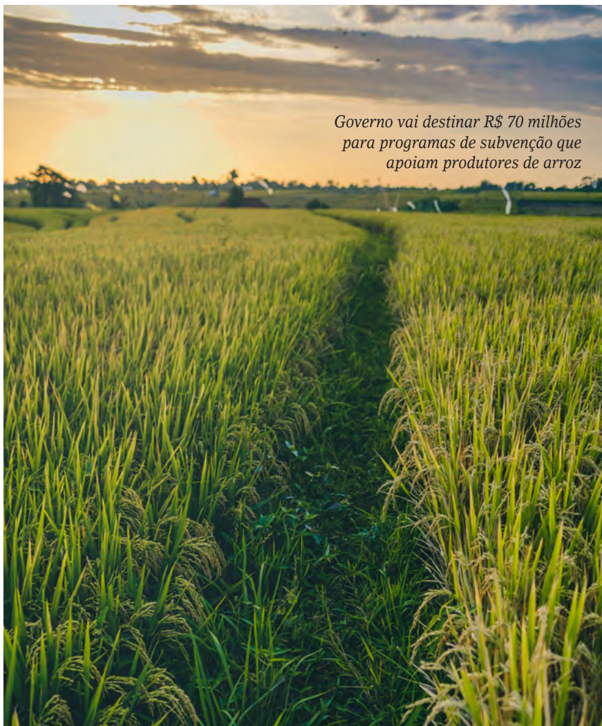
Governo vai destinar R$ 70 milhões para programas de subvenção que apoiam produtores de arroz

O Valor Bruto da Produção (VBP) da agropecuária é calculado periodicamente pelo Ministério da Agricultura. No ano passado, o faturamento bruto do setor somou R$ 1,41 trilhão. A perspectiva de retração para os meses à frente é fundamentada em dois fatores: a combinação de preços menores esperados para as principais commodities agrícolas no mercado global e uma desaceleração na produtividade média das lavouras nacionais. O arroz e o feijão estão entre os cereais que devem registrar diminuições. O primeiro de 30,6%, enquanto o feijão, de 8,8%, dados de recuo do faturamento bruto do produtor, nessa ordem. As receitas projetadas são de R$ 14,4 bilhões e R$ 10,7 bilhões, respectivamente.