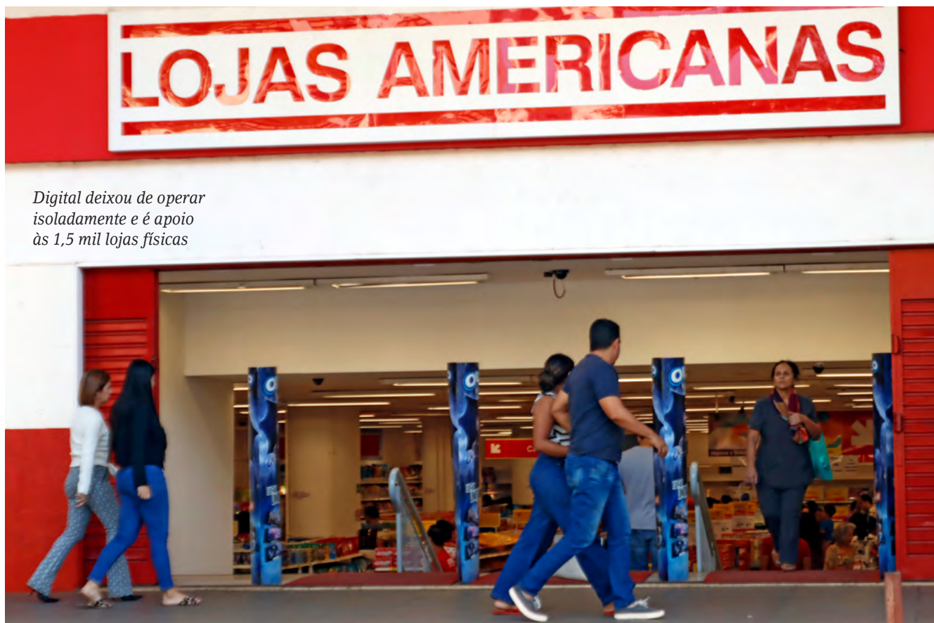
Digital deixou de operar isoladamente e é apoio às 1,5 mil lojas físicas