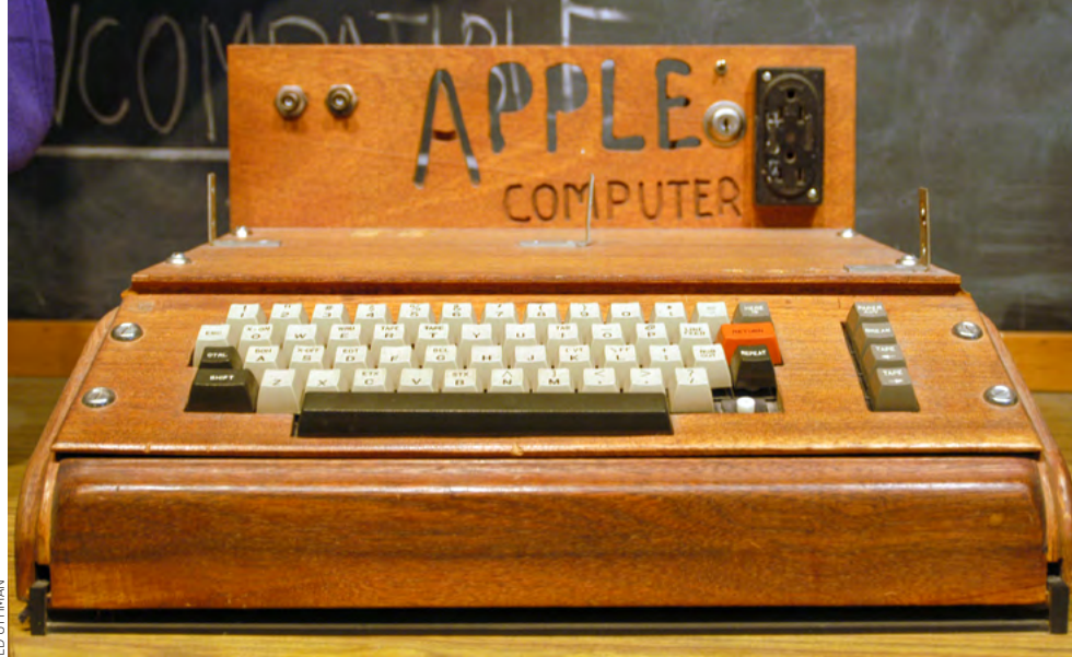
Apple deu os primeiros passos em 1976, quando era ainda a Apple Computer

Com tecnologias inovadoras que foram aperfeiçoadas por anos, como o touchscreen, o iPhone deu largada a uma nova era da comunicação. No mesmo ano, a companhia retirou “Computers” de seu nome, tornando-se apenas Apple Inc. Jobs perdeu a batalha contra um câncer pancreático raro em outubro de 2011, mas viveu o suficiente para ver seu produto quebrar barreiras mundiais e mudar a maneira como acessamos a internet.