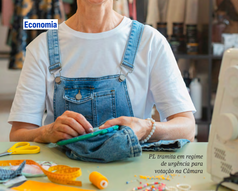
PL tramita em regime de urgência para votação na Câmara