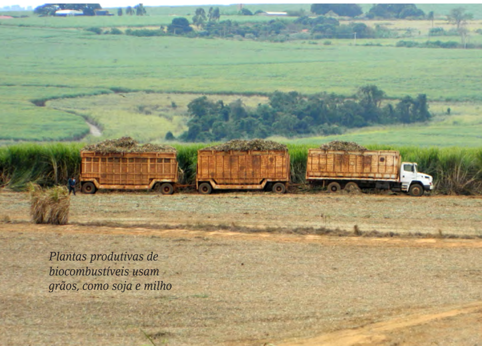
Plantas produtivas de biocombustíveis usam grãos, como soja e milho