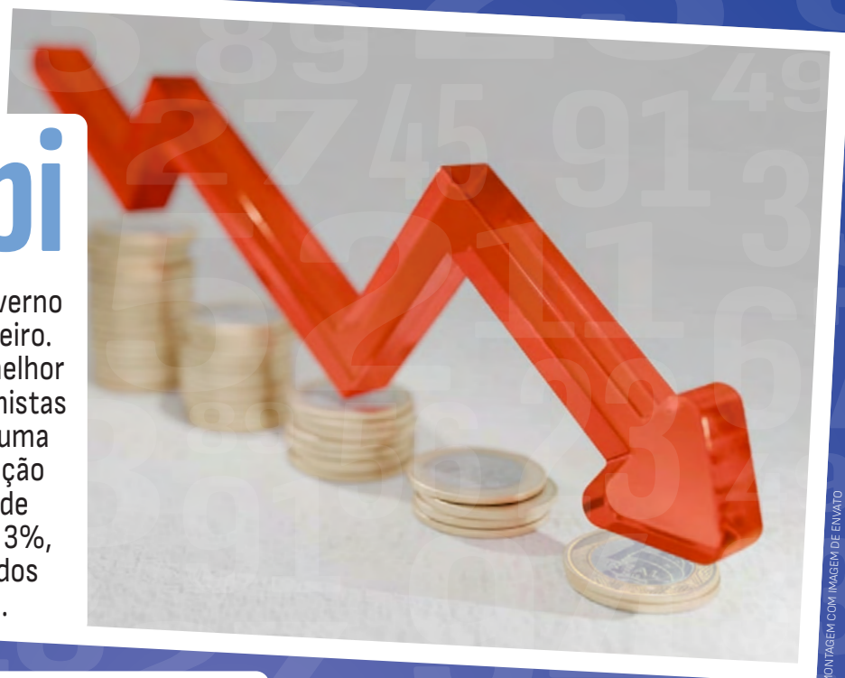
MONTAGEM COM IMAGEM DE ENVIATO

é o déficit primário do governo central registrado em fevereiro. O resultado é ligeiramente melhor que o esperado pelos economistas e mercado financeiro, com uma queda real de 8,4% em relação ao rombo do mesmo mês de 2025. A despesa total subiu 3%, para R$ 187 bilhões. Os dados são do Tesouro Nacional.