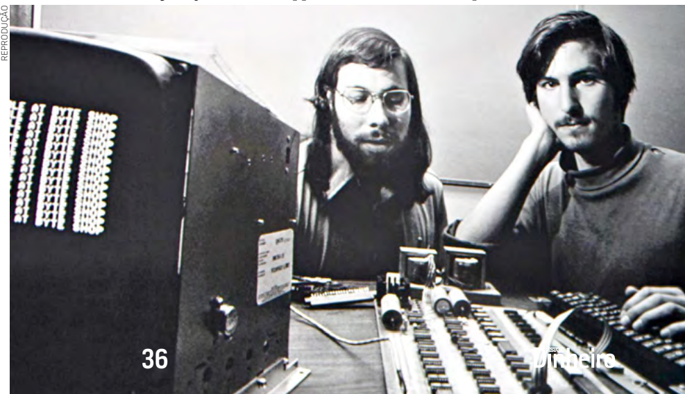
Steve Wozniak e Steve Jobs fundaram a Apple nos anos 1970 e o impulso veio em 2000