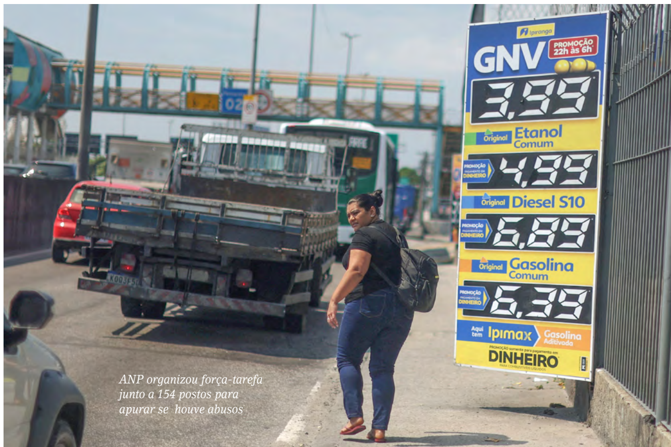
ANP organizou força-tarefa junto a 154 postos para apurar se houve abusos