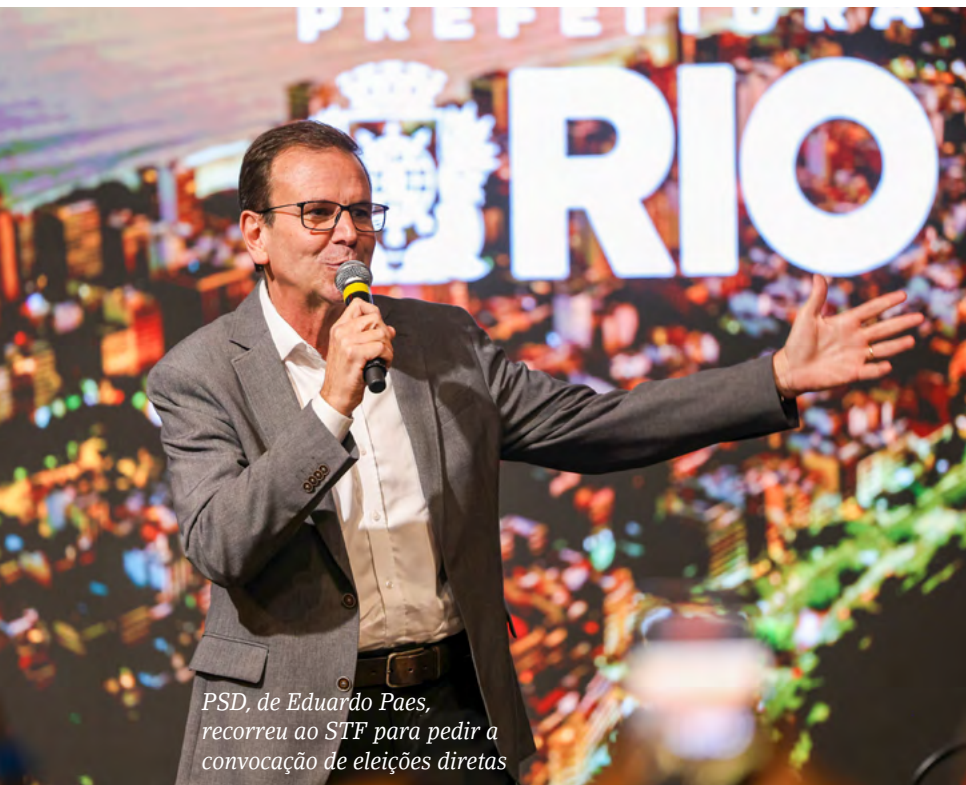
TOMAZ SILVARENCIA BRASIL

quisas, ele avançou ao segundo turno com 41,28% dos votos — contra 19,56% de Paes — e acabou eleito com boa vantagem. Seu companheiro de chapa era Castro, que ainda no PSC se tornara vice-governador.