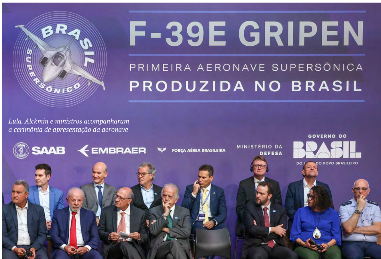
Lula, Alckmin e ministros acompanharam a cerimônia de apresentação da aeronave

engenheiros brasileiros treinados na Suécia, balizando a criação de mais de dois mil empregos diretos na frente de produção e outros dez mil postos de trabalho indiretos.