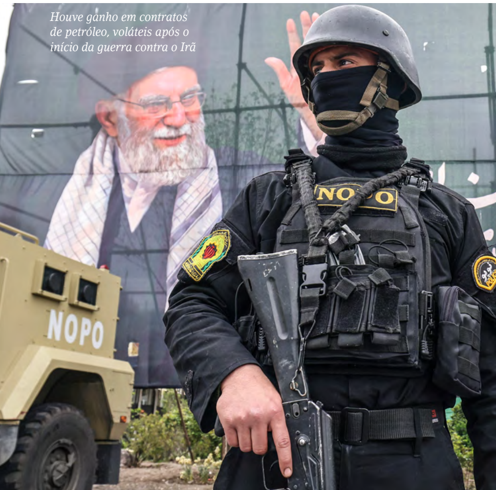
Houve ganho em contratos de petróleo, voláteis após o início da guerra contra o Irã

No Brasil, anúncios de Trump também geraram suspeitas de que informações privilegiadas chegaram ao mercado. A Advocacia-Geral da União identificou movimentações cambiais atípicas em 9 de julho de 2025, quando o americano afirmou que aplicaria uma tarifa de 50% sobre produtos brasileiros. Uma reportagem do G1 mostrou que menos de três horas antes de Trump publicar uma carta em apoio ao ex-presidente Jair Bolsonaro e sobretaxar o Brasil, operadores compraram entre US$ 3 bilhões e US$ 4 bilhões ao custo de R$ 5,46 o dólar. Após a publicação da Casa Branca, o câmbio subiu a R$ 5,60. O ministro do Supremo Tribunal Federal (STF) Alexandre de Moraes, determinou a abertura de uma investigação sobre o caso. D