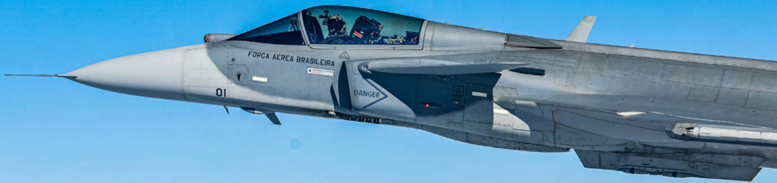
F-39 Gripen: caça fabricado no país atinge duas vezes a velocidade do som