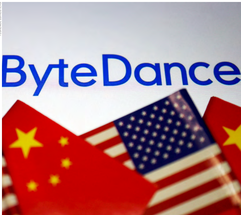
Chinesa ByteDance, dona do TikTok, terá 19,9% da empresa nos EUA