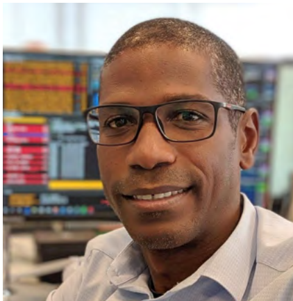
Lima, da Inter Asset: Copom tirou aviso de retomar alta caso necessário

ciclo de cortes comece com 0,25 ponto percentual (p.p.) e outros acreditam em cinco cortes consecutivos de 0,50 p.p.. Álvaro Frasson, estrategista macro do BTG Pactual Portfolio Solutions, espera que em março o corte seja de 0,25 p.p.. É uma visão de ‘corte com credibilidade’, com um BC mais comedido ao iniciar a flexibilização da política monetária. O modus operandi permitirá à autoridade monetária ter mais tempo para analisar uma nova rodada de dados de mercado de trabalho e atividade, ajudando a embasar as decisões seguintes do Copom.