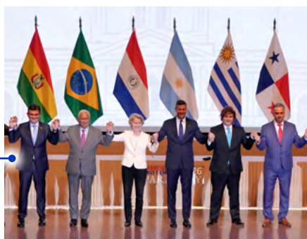
Mercosul-UE: travas e costuras políticas