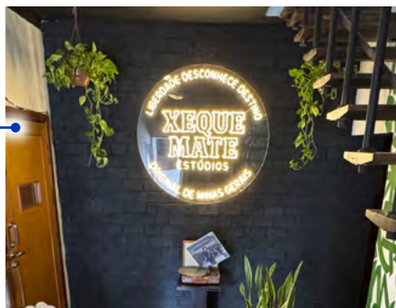
Xequê Mate traz nova bebida ao mercado