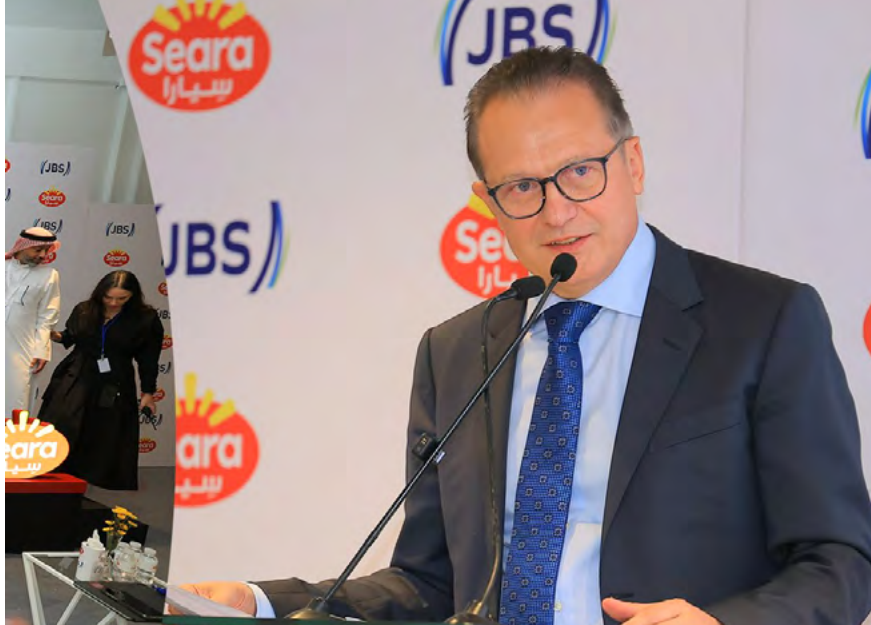
Gilberto Tomazoni, CEO global da JBS: expansão estratégica da Seara

A abertura de capital da joint venture na Arábia Saudita não inviabiliza o plano de abertura de capital da MBRF nos Estados Unidos, um outro interesse da gigante, mas complementa a estratégia de valorização global da companhia. A meta é aumentar o valor para a empresa diante dos investidores com potencial no globo. Vale, nesse contexto, rememorar o movimento recente que gerou a MBRF. A fusão entre Marfrig e BRF criou uma empresa com um portfólio mais amplo e capaz de competir com a JBS (que além da Seara, detém as marcas Friboi e Swift). No mercado global há outros concorrentes, como a Smithfield (da chinesa WH Group) e a norte-americana Tyson Foods. A criação da MBRF, autorizada no ano passado pelo regulador brasileiro, criou uma companhia com receita de R$152 bilhões por ano e presença em 117 países com as marcas Sadia, Perdigão e Bassi, entre outras, e tem produção estimada em 8 milhões de toneladas de produtos por ano.