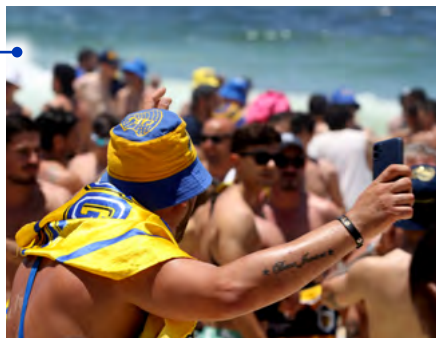
Turismo: a alta do fluxo de argentinos