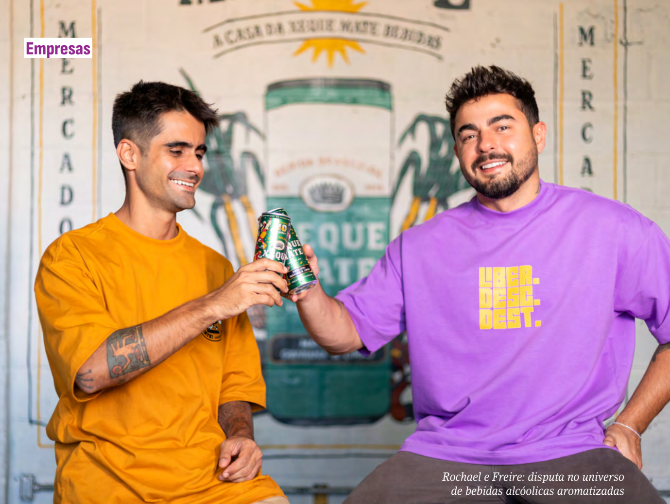
Rochael e Freire: disputa no universo de bebidas alcóolicas aromatizadas