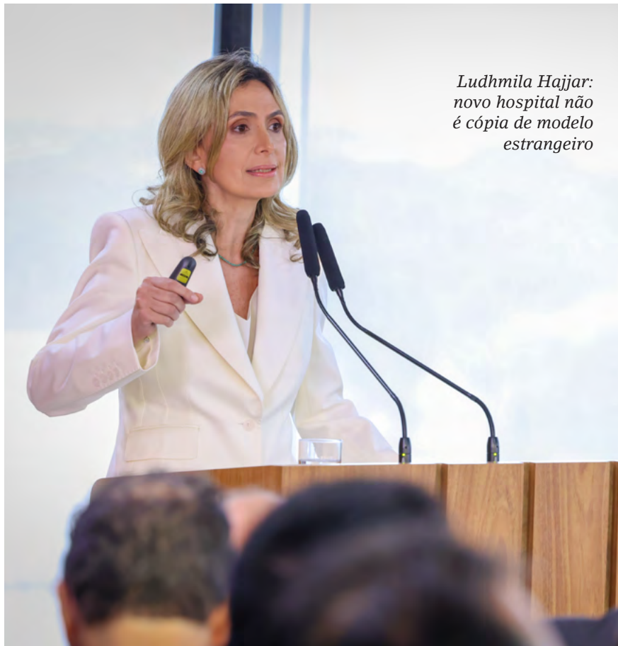
Ludhmila Hajjar: novo hospital não é cópia de modelo estrangeiro

Clínicas (HC), da Faculdade de Medicina da Universidade de São Paulo (USP). O projeto, portanto, conta com uma parceria do governo paulista.