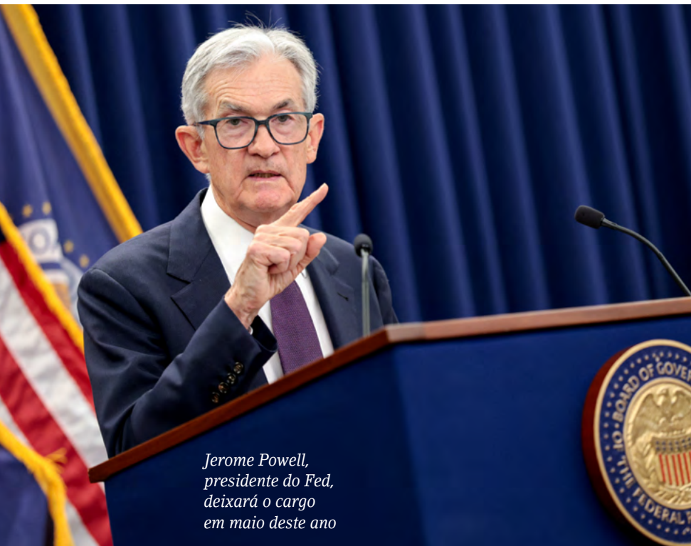
Jerome Powell, presidente do Fed, deixará o cargo em maio deste ano

Se por um lado as empresas estão atraindo capital, dentro delas, a previsibilidade para tomar decisões relacionadas à condução do negócio, o que envolve o fechamento de contratos, fica mais desafiadora em meio ao redesenho de parcerias entre países. Mesmo quem não exporta está sujeito às intempéries do mundo atual, caso, por exemplo, adquira matérias-primas de outros mercados. O risco é de “mão dupla”, avalia o professor da Fipecafi, Rogério Paulucci Mauad. “Se as ações de Trump elevarem a percepção de risco internacional, devido a tarifas e choque geopolítico, pode ocorrer o que o mercado chama de flight to quality. Ou seja: Trump pode, dependendo do contexto, enfraquecer ou fortalecer o dólar”, disse. O que muda, continua, é a percepção em relação à moeda americana, se “dólar como risco político” ou “dólar como porto seguro”,